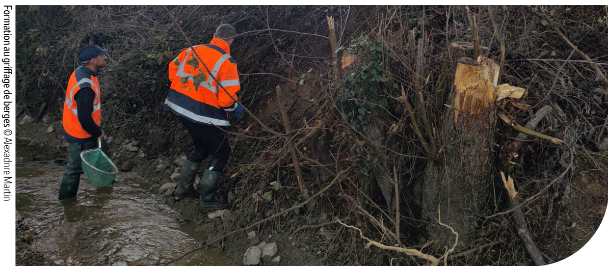
Formation au griffage de berges